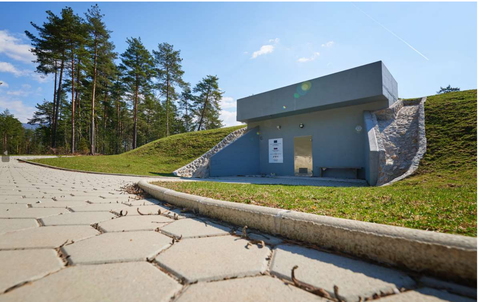
Slika 2: Vodohran Zeleni hrib

Pripravili: Boštjan Dobrovoljc, vodja sektorja Vodovod Polona Kovač, strokovna sodelavka za kontroling